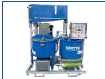
IS-35-EF mit Wassertank