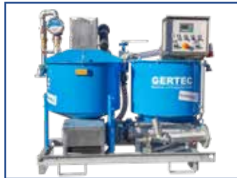
IS-35-E IS-35-light IS-35-EF inkl div. Zubehör